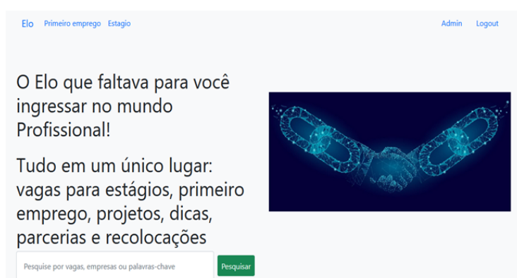
Figura 1: Interface principal da aplicação

A seguir serão apresentadas as interfaces principais da plataforma ELO, por meio da visualização das imagens, será possível compreender um pouco mais sobre o funcionamento da mesma.