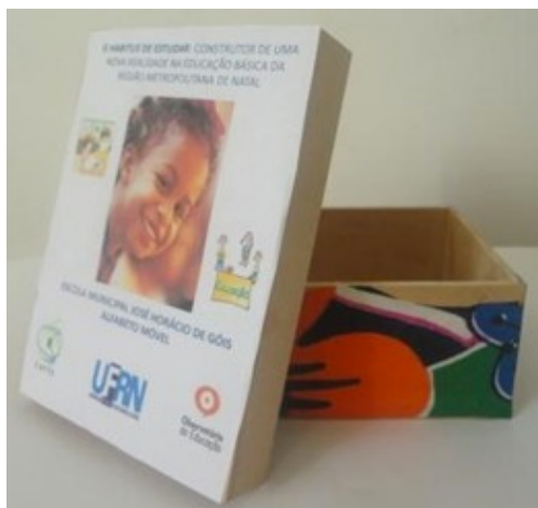
Figura 05: Alfabeto Móvel produzido pela autora como instrumento de pesquisa.

Entre os meses de março e abril de 2013, reaplicamos os instrumentos de Língua Portuguesa e Matemática nas turmas do 2º ano e 5º ano das escolas participantes da pesquisa. Nas duas escolas ficou evidente que o alfabeto móvel foi uma ferramenta pedagógica eficiente, despertando nos alunos maior interesse pelo aprendizado e diminuindo dificuldades em alunos que imaginavam não ter condições para aprender e, conseqüentemente, se alfabetizarem. Isso se refletiu nos arranjos e produções escritas dos alunos, que sinalizaram avanços significativos.