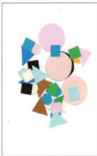
Figura 01: Material utilizado na confecção de um arranjo com formas geométricas.

O instrumento de Matemática foi confeccionado considerando-se a faixa etária dos grupos, bem como as aprendizagens matemáticas construídas. Aos alunos do 1º ano foram entregues 05 questões nas quais as crianças tinham que contar objetos (figuras de coelhos, vacas, cachorros, meninos e geométricas) e escrever os números correspondentes; essa contagem solicitava a sequência de 01 a 10. Os estudantes do 4º ano tiveram que resolver 05 problemas de enredo envolvendo as operações de soma e subtração entre números compostos por unidade, dezena e centena, conforme apresentado nas Figuras 01, 02, 03 e 04 a seguir: